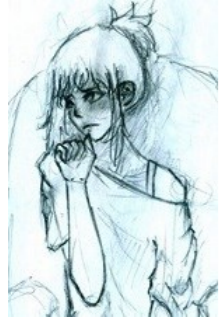
Рисунок Николаевой Василисы, 11Б