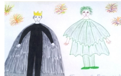
Рисунок Виталия Пастухова, 2Б