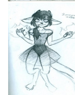
Рисунок Инкогнито, 11Б