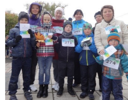
2Г класс на Дне ходьбы