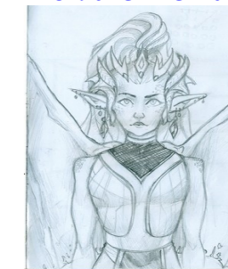
Рисунок Бобровой Насти, 10Б