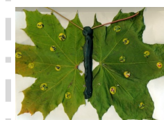
Поделка Корзун Ульяны, 3Б