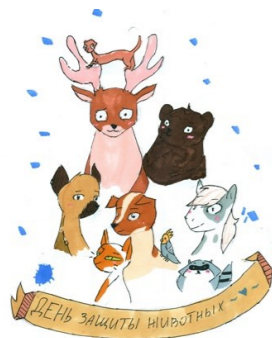
Рисунок Нигматуллиной Насти, 10 В