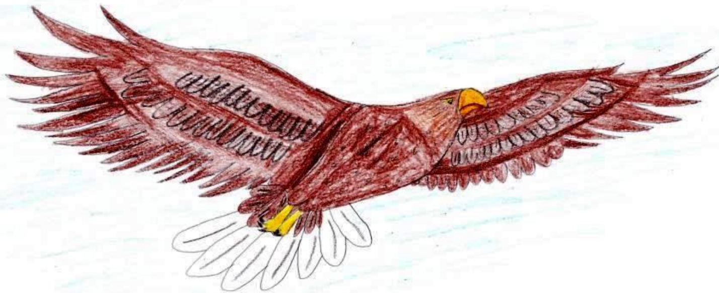
ОРЛАН - БЕЛОХВОСТ

Один из самых крупных хищных птиц. Обитает везде, кроме арктических тундр и южных пустынь. Питается рыбой и водоплавающими, птицами и мелкими млекопитающими.