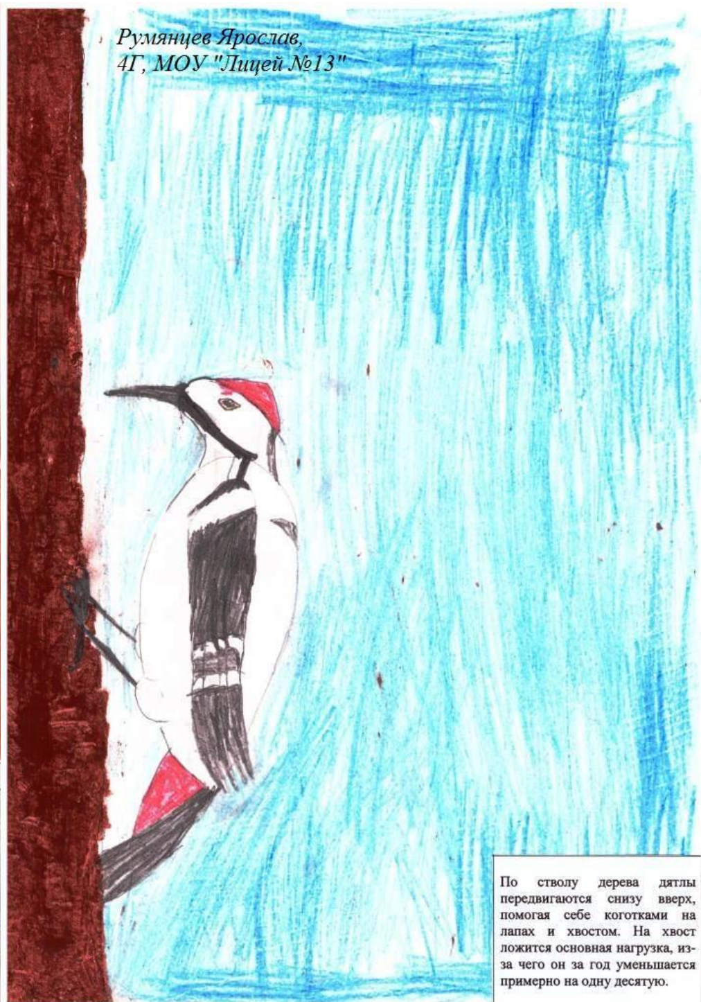
Румянцев Ярослав, 4Г, МОУ "Лицей №13"

Белоспинный дятел. Еще одна разновидность большого пестрого дятла. Средняя величина самки около 10 см, самцы, конечно, размером от большого пестрого дятла. Его отличает белая нижняя часть спины и белая шапочка перед глазами.